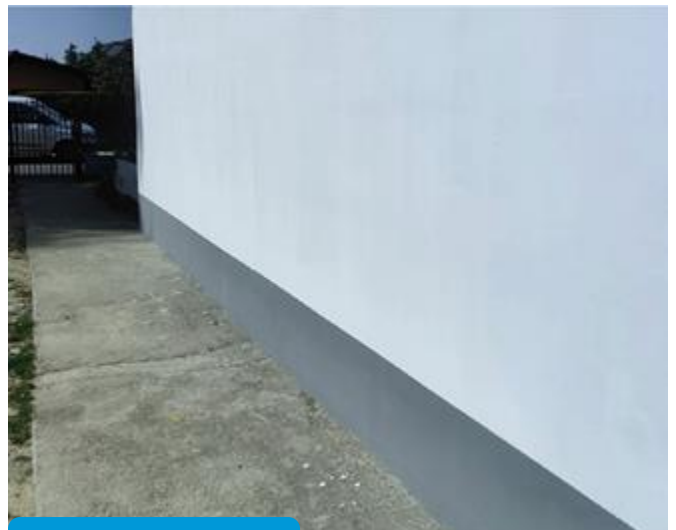
Efekt końcowy >