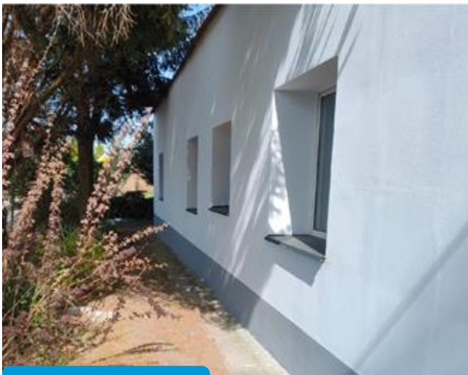
Efekt końcowy >